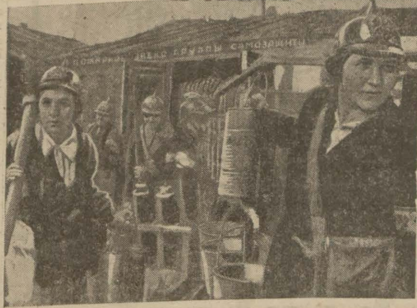
Moskova bombardmanlarına aid bir intiba: Sovyet kadımlarından mürekkep itfalye grupları faaliyettedir

Londra 24 (A.A.) — Moskova radyosunun bildirdiğine göre, şimdiki genel altında bulunan Fransa 10.000 ve isgal altında bulunmayan Fransa da 40.000 Fransız tevki edilmiştir.